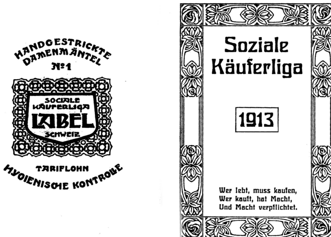
Abb. 1: Taschenkalender der Sozialen Käuferliga Schweiz auf das Jahr 1913, Wahlspruch der französischen und schweizerischen Liga: »Wer lebt, muss kaufen,/Wer kauft, hat Macht,/und Macht verpflichtet.«

tagsarbeit verursachen; Aufträge nicht auf den letzten Augenblick zu schieben und Rechnungen pünktlich zu bezahlen. 207