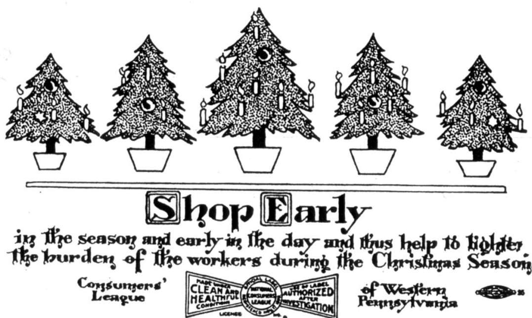
Abb. 2: Weihnachtliche Illustration für einen Spendenaufruf zur Unterstützung der »Shop early«-Kampagne der New Yorker Käuferliga, um 1912

auf die Produzenten wie auf die Konsumenten. Im Fieber des ökonomischen Lebens, so ein Chronist der französischen Käuferliga, bliebe nämlich der Einfluss der Konsumenten fast unbemerkt: »Parmi les agitations, les turbulences et les fièvres de la vie économique, silencieux, modeste, effacé, le consommateur a passé jusqu'ici presque inaperçu.« 209